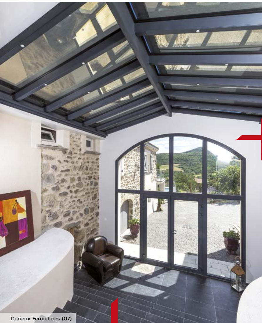
Durieux Fermetures (07)