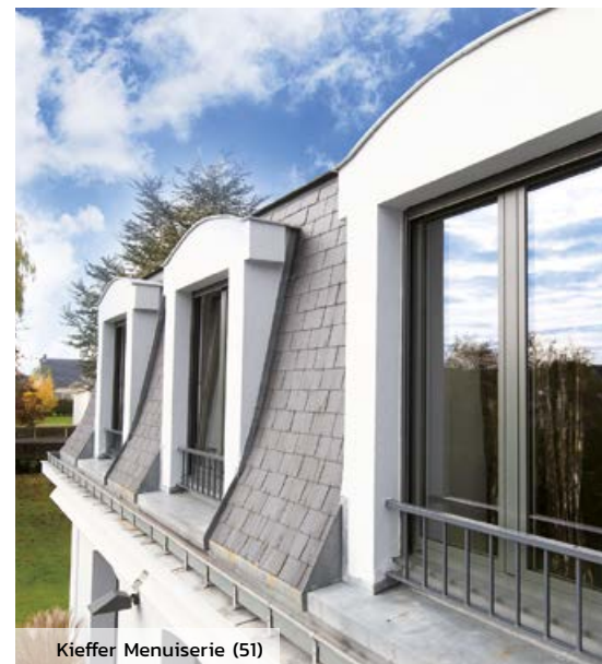
Kieffer Menuiserie (51)