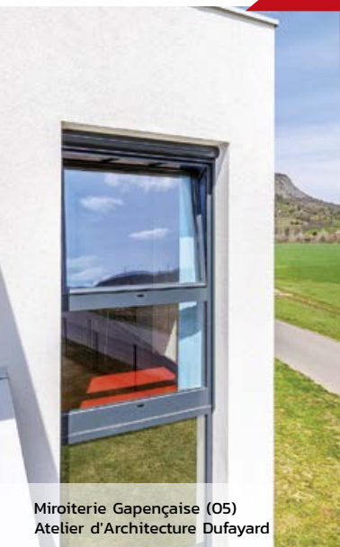
Miroiterie Gapençaise (05) Atelier d'Architecture Dufayard