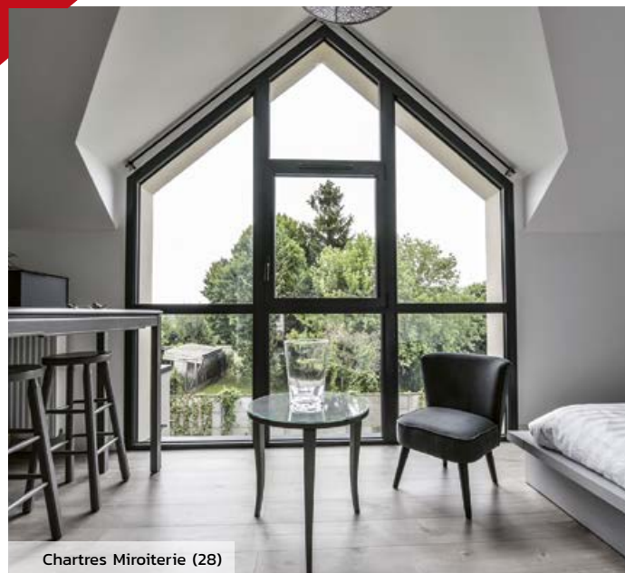
Chartres Miroiterie (28)